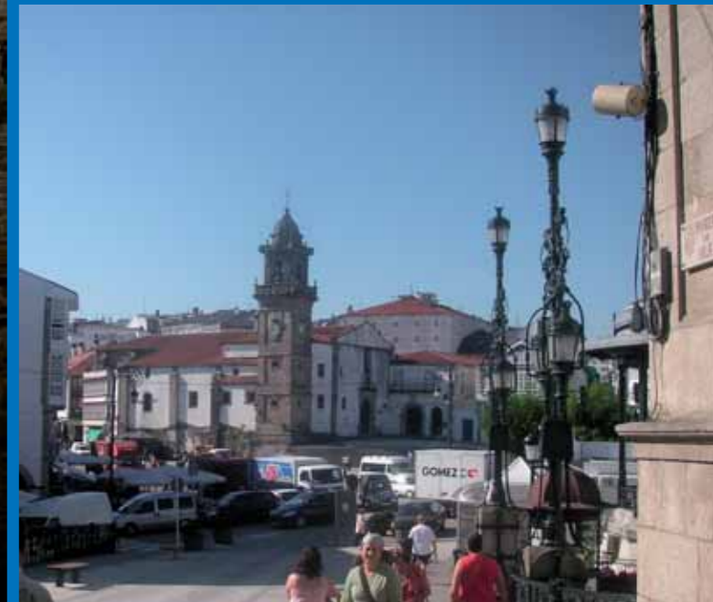
El Camino Inglés pasa por el centro de la ciudad.